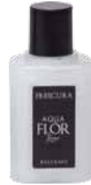
50 ml Balsamo Conditioner