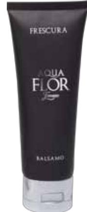
75 ml Balsamo Conditioner