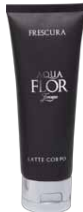
75 ml Latte Corpo Body Milk