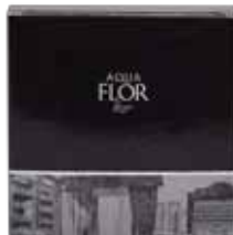
Cuffia Doccia Shower Cap