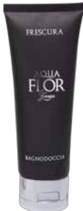
75 ml Bagnodoccia Shower Gel