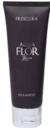
75 ml Shampoo