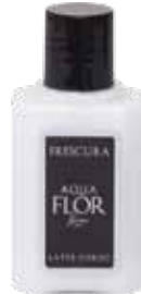
50 ml Latte Corpo Body Milk