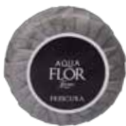
30 gr Sapone Soap