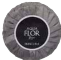
50 gr Sapone Soap